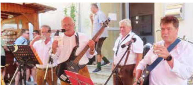
Musik mit Rebenland Oldies