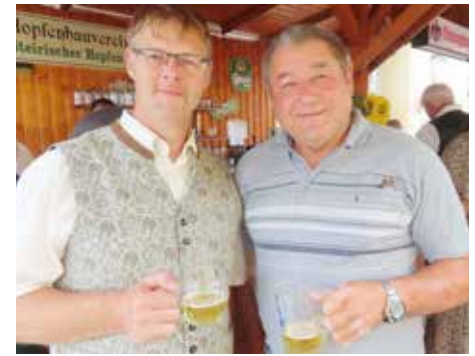
Neuer und alter PGR-Obmann