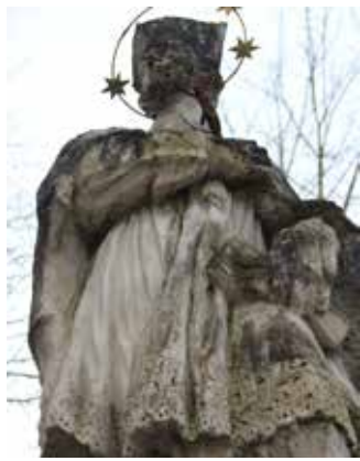
Vor der Restaurierung...

Die Statue am Kirchplatz war durch Jahrzehnte der Witterung ausgesetzt und in einem dementsprechend verwitterten und verschmutzten Zustand. Durch die Renovierung der Grazer Restauratorin Barbara Fiedler erstrahlte die wunderschöne Statue aus der Barockzeit wieder in neuem Glanz mit der Sternenkrone und dem goldenen Kreuz in der Hand. Die bisherigen Kosten für die Wiederherstellung der Figur wurden durch Großspender und Fördermittel des Landes eingebracht.