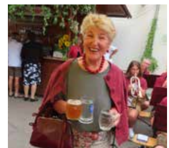
Besucherin aus Oberhaag