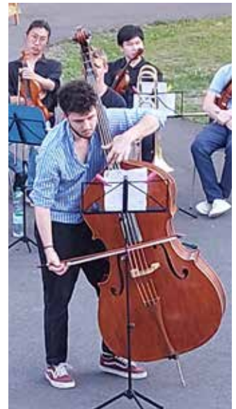
Kontrabass beim Konzert im Schulhof