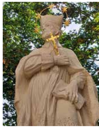
...nach der Restaurierung!