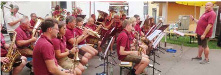
Musikkapelle MV Leutschach

sowie einen Kaffee- und Kuchenstand. Für das leibliche Wohl war also bestens gesorgt. Das Fest dauerte bis in die Abendstunden und die vielen vielen Gäste haben sich bestens unterhalten. Ab dem frühen Nachmittag gab es steirische Musik vom Feinsten mit der Gruppe „Oldtimer Rebenland“.